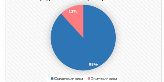
Разпределение на акционерния капитал